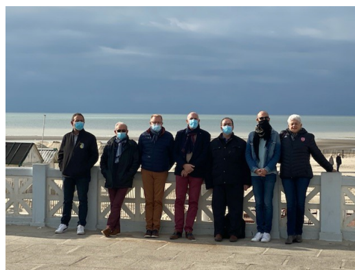
Les Présidents des Comités BFC à l'Assemblée Générale de la FFBB